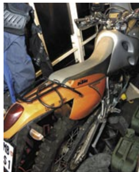
Mislil je tudi na svoje konjičke, saj je zadnji del urejen v garažo, kjer je prostora za dva motorja in potapljaško bazo.