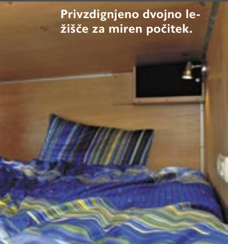
Privzdignjeno dvojno ležišče za miren počitek.