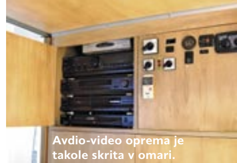
Audio-video oprema je takole skrita v omari.