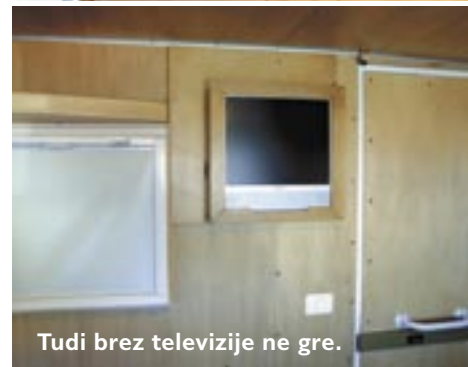
Tudi brez televizije ne gre.